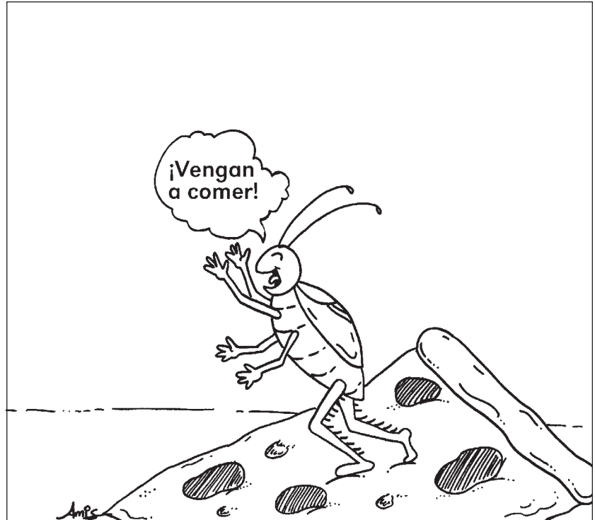
Figura 4-3. Un pedazo de pizza, que se deja en la superficie toda la noche es un banquete para las cucarachas.

Antes de comenzar una revisión detallada del área, revise por completo el sitio, por dentro y por fuera. Haga un dibujo del patrón de tráfico que sigue la gente. Especialmente, ¿por dónde se