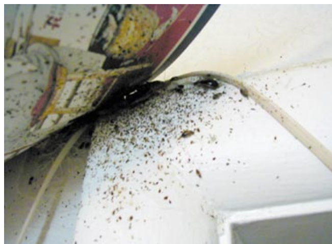
Figura 4-2. Las cucarachas alemanas y las manchas de heces en el marco de la puerta, debajo de un calendario.

Mientras haga la inspección, buscará cucarachas vivas, cucarachas muertas, cascarones de cucarachas o partes de cucaracha. También busque por cápsulas vacías o llenas y manchas de cucaracha o manchas de las heces (Figura 3-10 y Figura 4-2). La inspección le ayudará a identificar la cucaracha, a identificar en dónde se encuentra la infestación, y a identificar el tamaño de la infestación y las condiciones que estén a favor de que las cucarachas sobrevivan.