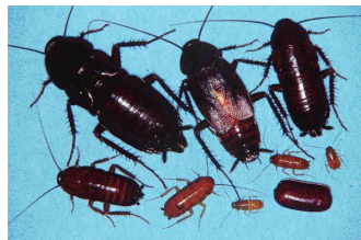
Figure 2. la cucaracha oriental