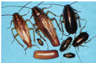
Figure 1. la cucaracha alemana

El saber la clase de cucarachas que Ud. tiene le puede ayudar a entender donde enfocar sus esfuerzos de inspección. Use las ilustraciones para ayudarle. Encuentre las fuentes de la infestación de cucarachas con inspeccionar y usar trampas pegajosas para capturarlas. Dibuje un esquema de cada cuarto,