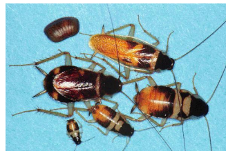
Figure 3. la cucaracha de raya café